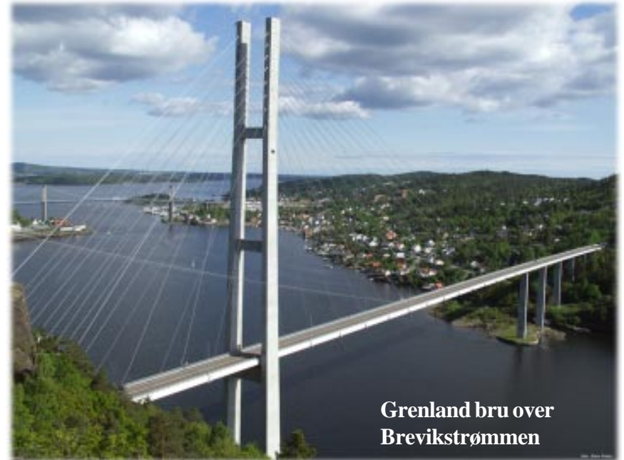
Grenland bru over Brevikstrømmen